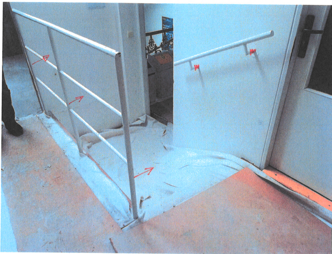
ZL 13 – Foto dokumentace - Příloha č. 3